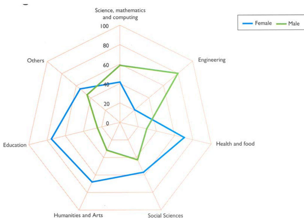
Figura 1. -Proporción de graduados por área de conocimiento. EU, 2000

La proporción de mujeres estudiantes de ciencias e ingenieras está creciendo en Europa de modo constante. Así, son más del 50% de los estudiantes de áreas de ciencias de la vida ( en algunos países el 75%) más del 30% en matemáticas, 20% en ingeniería y 19% en informática (fig. 1). De hecho, como media de todas las disciplinas, son mayoría las nuevas licenciadas en todos los países de Europa, excepto en Austria.